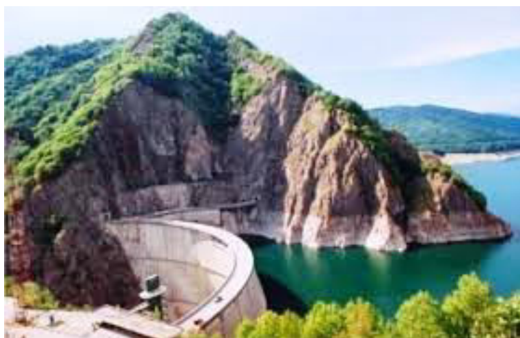
Pe râul Jiu se construiește un baraj.