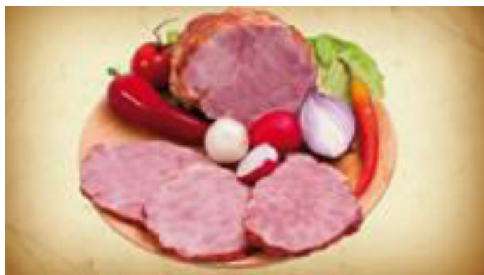
La dejun mănânc jambon.